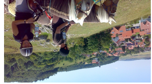
WANDERREITEN RUND UMS RIES - Kühstein