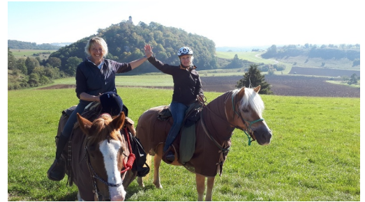
WANDERREITEN RUND UMS RIES - Michelsberg

Ende der Tour WanderReitbetrieb Hof Kranichau