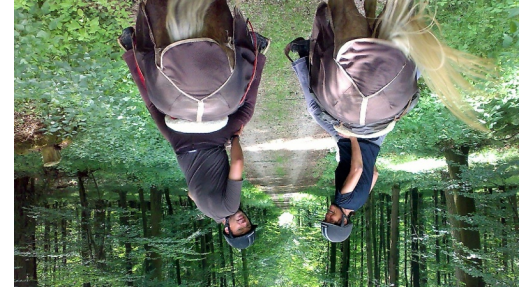
WANDERREITEN RUND UMS RIES - Kühstein