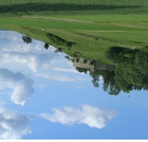
WANDERREITEN RUND UMS RIES - Schloss Alerheim