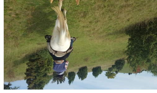
WANDERREITEN RUND UMS RIES - Schloss Alerheim